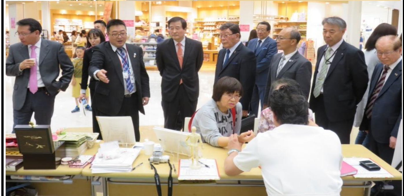
モール内視察の様子