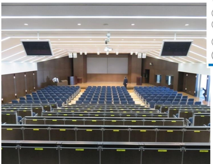
会場の愛知大学車道校舎コンベンションホール