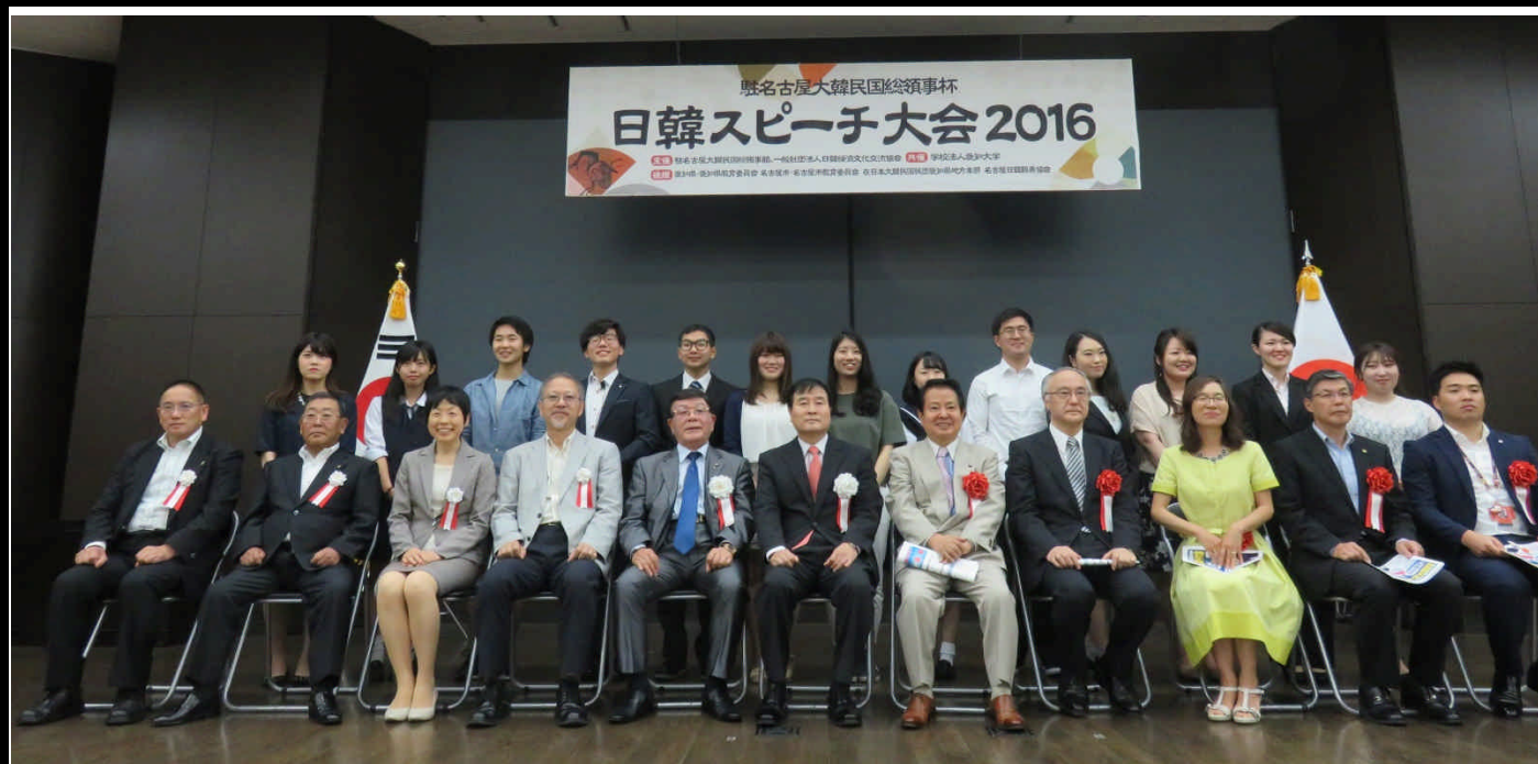
平成28年6月18日（土）愛知大学車道キャンパス3階コンベンションホールにて「駐名古屋大韓民国総領事杯 日韓スピーチ大会2016」が開催されました。予選から選抜された13名の弁士は、日本の学生は韓国語で、韓国の学生は日本語で発表し、母国語訳をスクリーンに映す方法は「見やすい、分かりやすい」と好評でした。

また日韓往復航空券の他、多くの賞品が用意された参観者向けの大抽選会は、大いに盛り上がりました。本大会が無事に終わられましたのも、関係各位のご支援ご協力の賜物であり、改めて御礼申し上げます。誠にありがとうございました。