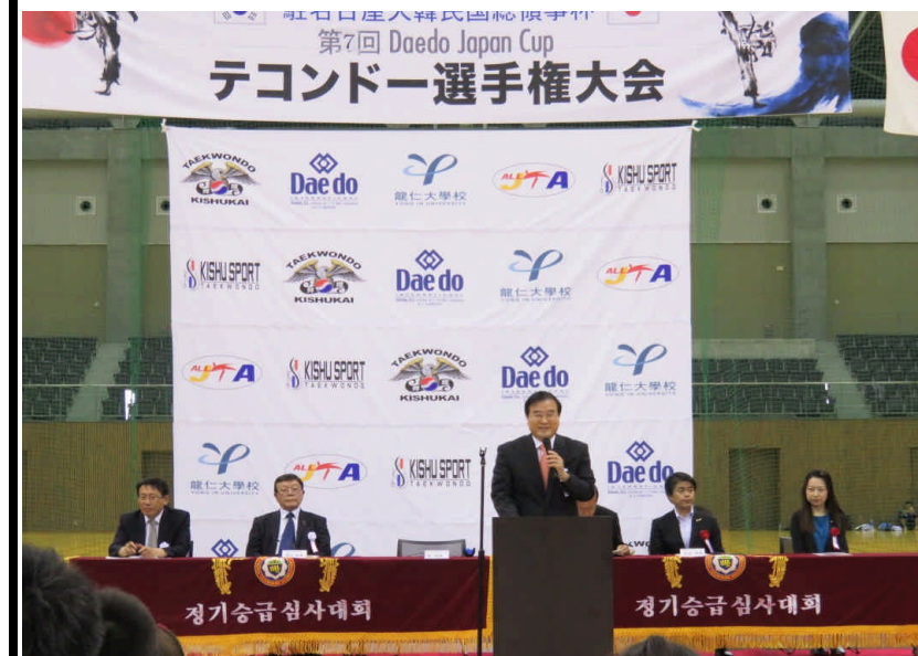
祝辞を述べられる朴煥善総領事