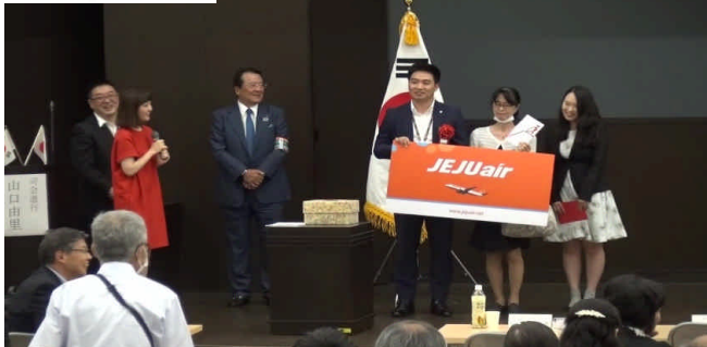
大抽選会の特賞は日韓往復航空券